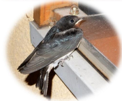
事務所の窓まで降りてきました