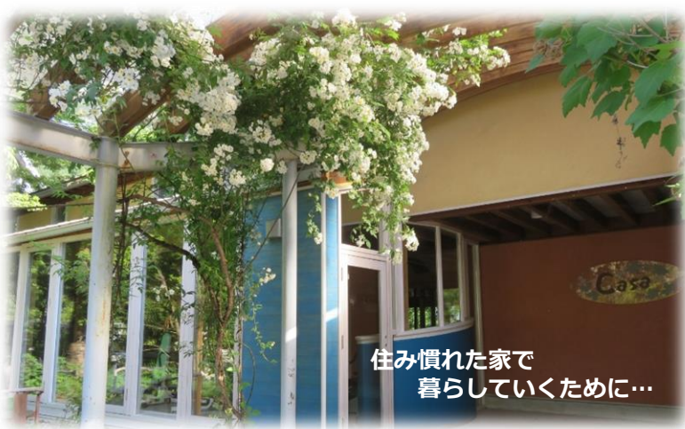
住み慣れた家で暮らしていくために…

6月1日からカーサでは養父市総合事業、「通所型生活機能向上サービス」が始まりました。